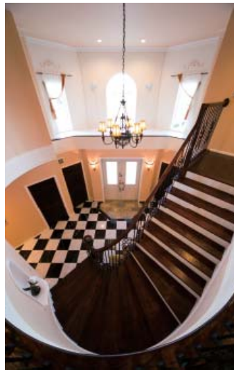
エントランスホールの吹き抜けは、柔らかな光のドームとなって日々、目と心を和ませる