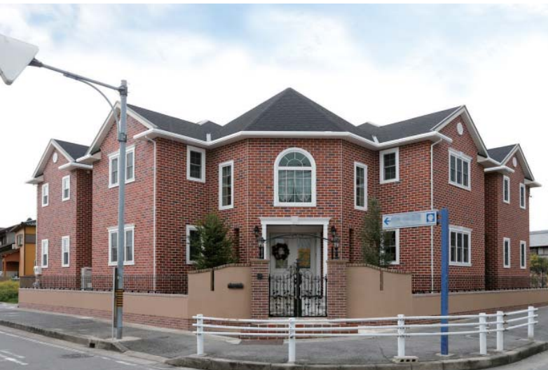
ジョージアン様式に特徴的なシメトリなデザインが、どの方向からも美しく見えるよう、正面を敷地の角に配置。やや明るめの煉瓦の壁に整然と並ぶ窓が、端正さを際立たせている