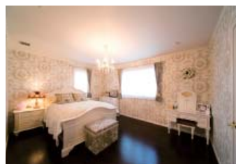
寝室は大ぶりのパターンがクラシカルな印象の壁クロスを選び、がらりと雰囲気を変えて