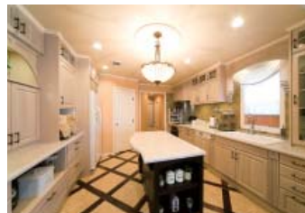
キッチンフルオーダーメイド。本格的な輸入スタイルだが、実は機能性に優れた日本製