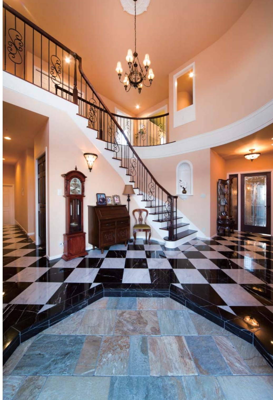
優雅なラインを描くサーキュラー階段を中央に、ダイナミックな吹き抜けが広がる迎賓空間。大理石の床の市松模様が、クラシック・モダンなアメリカンスタイルを印象づける（見開きの写真はすべて同一施工例 設計・施工/ブルースホーム三河中央）