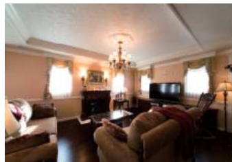
アメリカ住宅のスタンダード、全館空調を採用して、家中のすみずみまで快適に