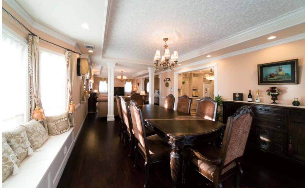
息につながるダイニングとリビングの間に、あえてコラム柱の装飾を加えることで、ゾーニングと落ち着きを演出。レリーフを施したモールドリングやシャンデリアの根元を飾るメダリオン、無垢床のシックな色合いなど、どこまでも華麗でエレガントな空間だ