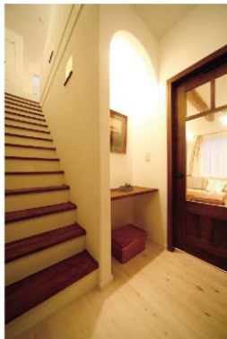
シンプルで心を込めた迎賓空間