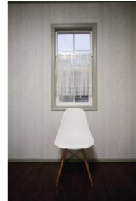
窓枠をテーマカラーで塗り分けた