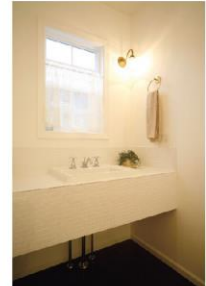
タイル貼りの洗面はオリジナル