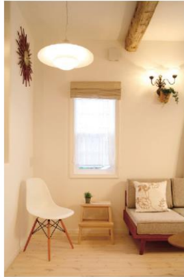
目指したのは、お気に入りのイームズのチェアが似合う家