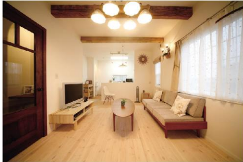
ナチュラルな素材感と北欧テイストがほのかに漂うリビングルーム