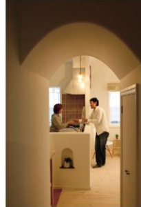
アールの塗り壁が柔らかな表情に