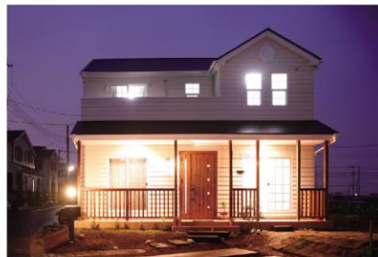
ラップサイディングにカバードポーチ